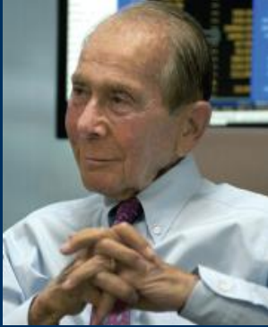
Maurice R. Greenberg